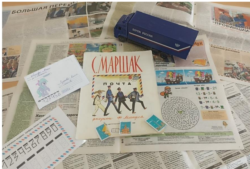
Рисунок 6. Пример буклука (книжного натюрморта) к произведению