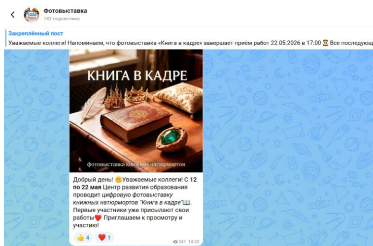
Рисунок 1. Скрин канала фотовыставки

Регистрация участников - в период с 12 мая по 22 мая 2026 г. посредством заполнения электронной формы по ссылке, экспозиция лучших работ – на канале «Мах» в период с 22 мая по 29 мая 2026 по ссылке: https://clck.ru/3SzCCo .